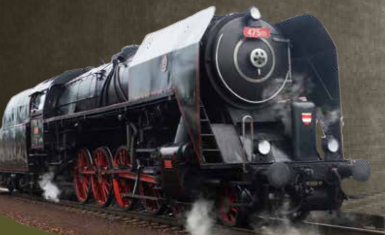
parní lokomotiva 475.1 (Šlechtična) s rybáky

V letošním roce jsme si pro Vám připravili následující akce: