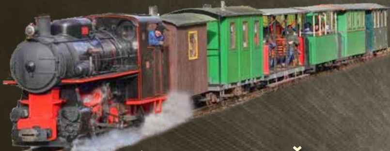
úzkokolejné vlaky MPŽ