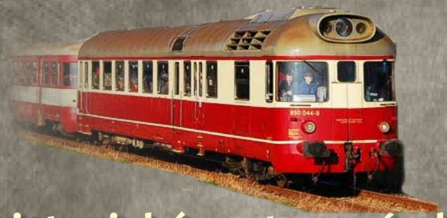
historický motorový vlak